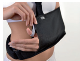
Optionnel : lien de soutien du pouce